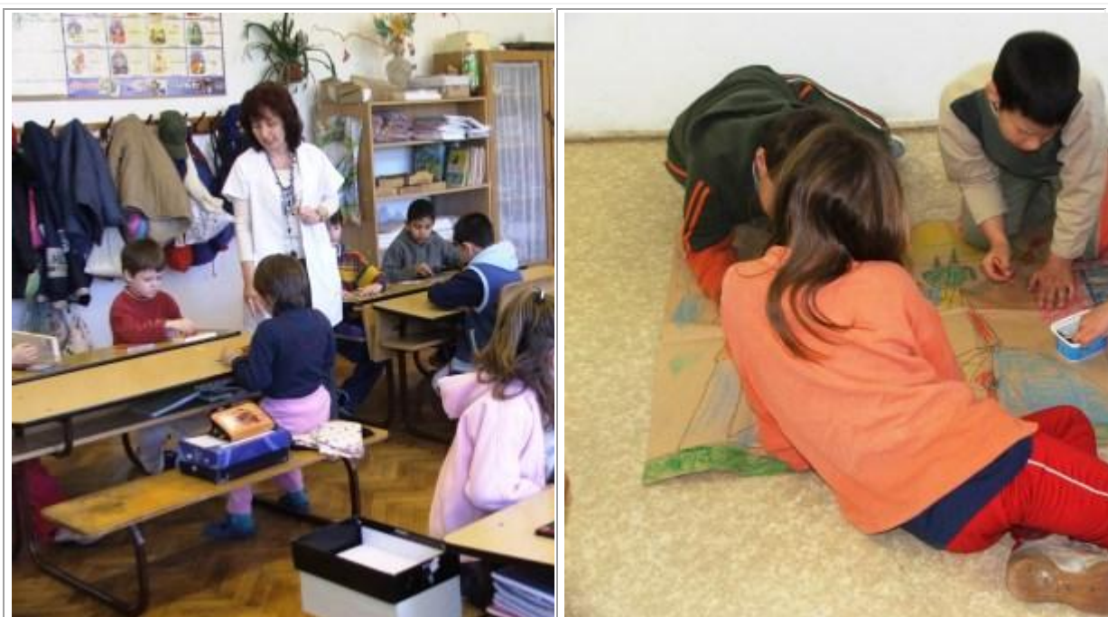
Csoportmunkák az első osztályban

Kompetenciaalapú oktatás az az oktatás, amely előre meghatározott kompetenciák megszerzésére irányul. A tanulók tudását, teljesítményét individualizált módon mérik. Kompetenciaalapú oktatásnak a képességek, készségek fejlesztését, az alkalmazásképes tudást