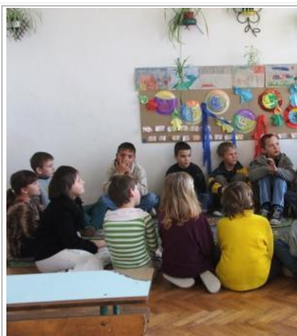
Beszélgető kör második osztályban